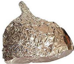
Kuvan foliohattu ei liity tapaukseen

Onko sinulla risuja, ruusuja, tai vain asiaa muille verbalaisille? Lähetä tekstiviesti osoitteeseen reemankuumalinja@gmail.com. Tekstiviestin hinta 0,0€/kpl+pvm. Pidätämme oikeuden olla julkaisematta asiattomia viestejä.