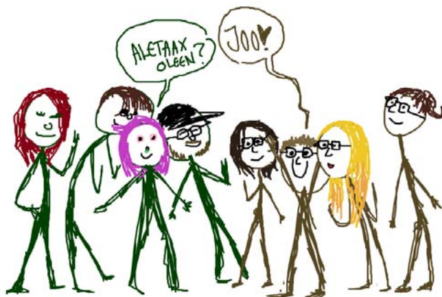
Kultun Sumu Posion näkemys retkueestamme

Kultulaisten vieraanvaraisuus ja yhteistyöhaluisuus lämmittivät kylmää sydäntäni, ja toivonkin, että yhteistyötä voitaisiin jatkaa tulevaisuudessakin!