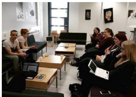
Ensimmäinen verbaistuki järjestettiin vuonna 2016

Verbassa sopot ovat järjestäneet yhdessä koulutuspoliittisten vastaavien, eli kopo- jen, kanssa Verbaistukea johon voi mennä yhdessä muiden opiskelijoiden kanssa vastaanottamaan vertaistukea yliopiston kurssien suhteen. Joskus verbaistuessa on ollut myös vastaavia opettajia luennoimassa!