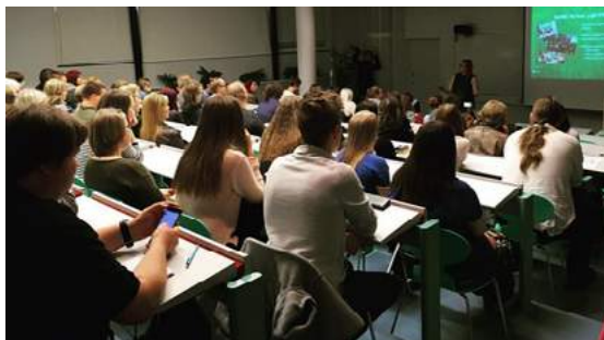
Fuksit vuosimallia 2016 kuuntelemassa Verba-infoa.