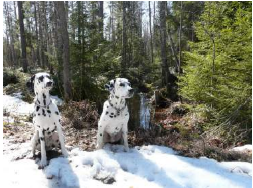
Wappu-Reema 2/2019 (c) Verba ry

Päätoimittajat: Sara Junttila, Joni Jäntti & Joonas Uusitalo