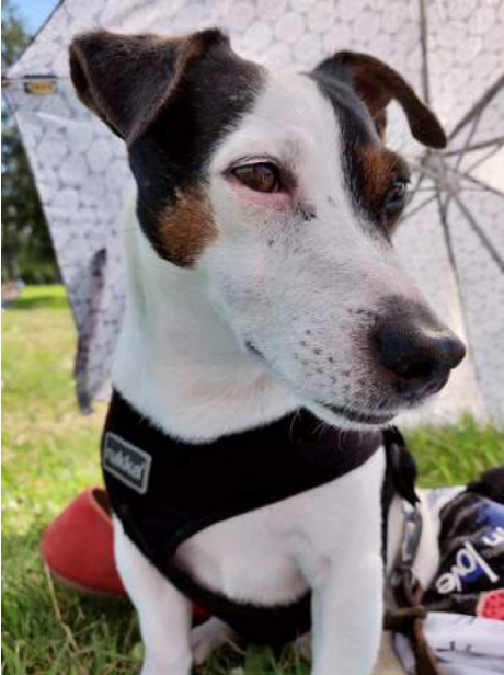
Kuvituskuva. Kuvan koira ei liity tapaukseen.